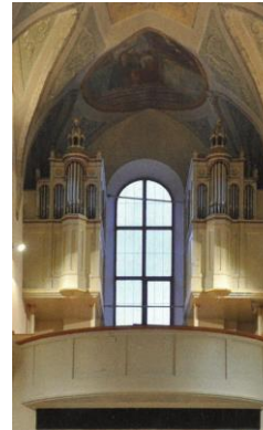
Die Orgel der Gebrüder Rieger (D) aus dem Jahr 1914, restauriert von Paolo Ciresa (Trentino; 1983) und Orgelbau Kuhn (Schweiz; 2009) in der Pfarrkirche Gais