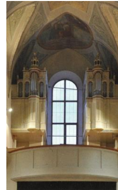
Die Orgel der Gebrüder Rieger (D) aus dem Jahr 1914, restauriert von Paolo Ciresa (Trentino; 1983) und Orgelbau Kuhn (Schweiz; 2009) in der Pfarrkirche Gais