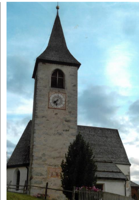
Die kleine Kirche von Tesselberg

Die Pfarrkirche von Rein ist dem heiligen Bischof Wolfgang von Regensburg geweiht (gemeinsam mit dem hl. Ulrich, dem Bischof von Augsburg und geistlichem Freund des hl. Wolfgang). Der Gedenktag des hl. Wolfgang ist der 31. Oktober. Wir feiern das Namenstagsfest der Kirche von Rein am So, 30.10.2022 im Rahmen der 10.15-Uhr-Messe. Die Pfarrmitglieder sind herzlich eingeladen dazu.