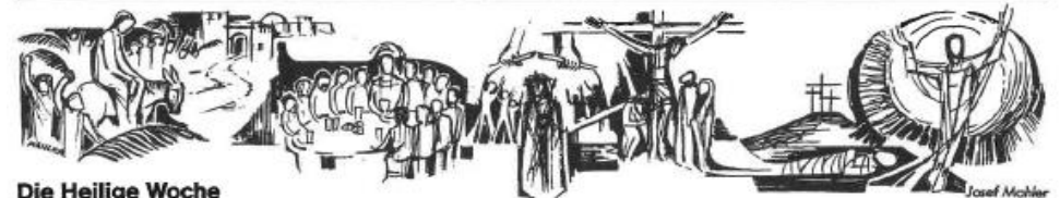
Die Heilige Woche